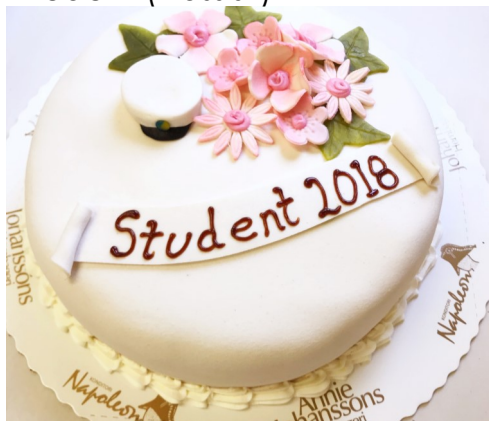
Modell 1 (klassisk)