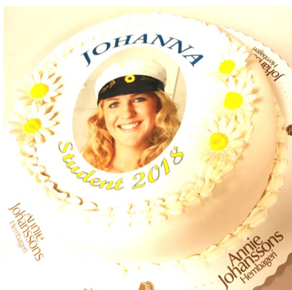
Modell 3 (prästkragar)